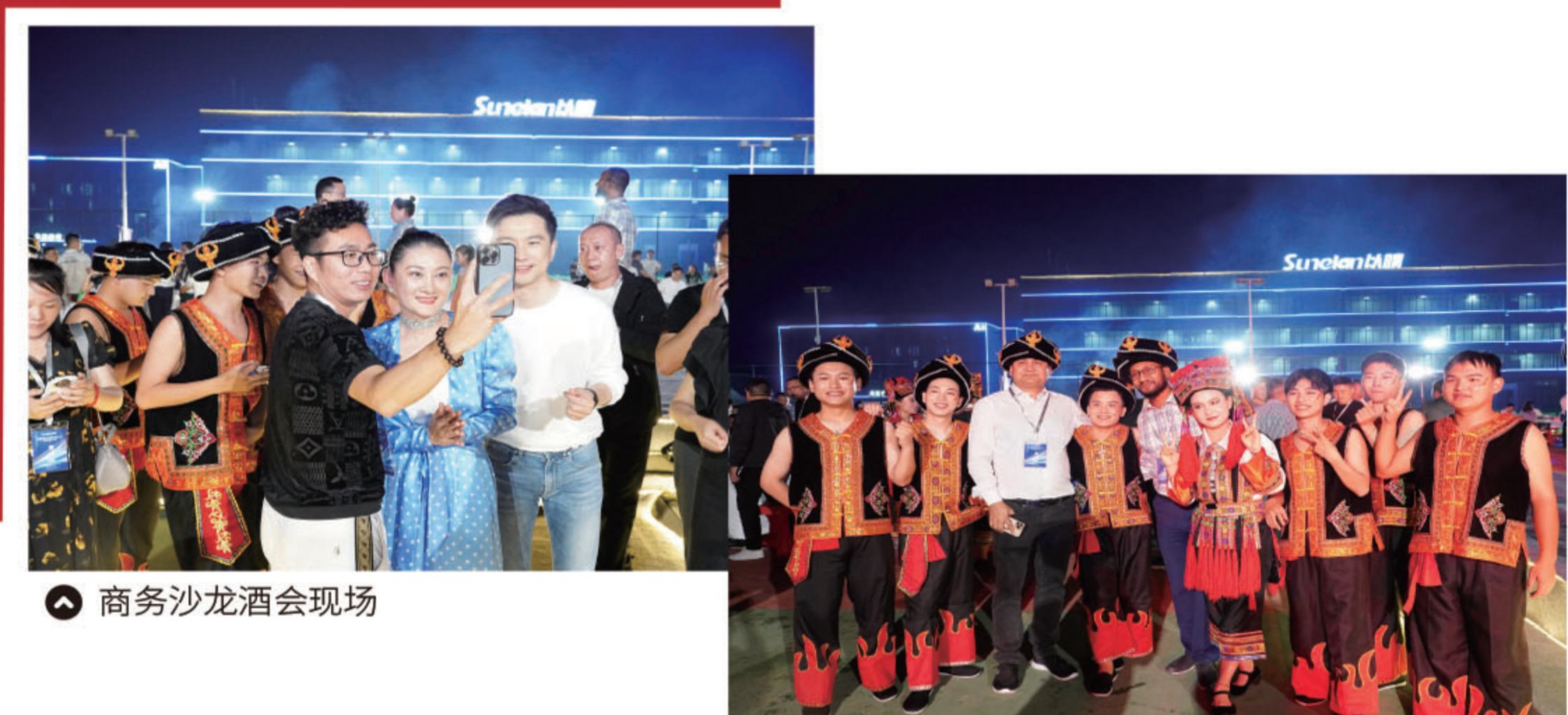
商务沙龙酒会现场