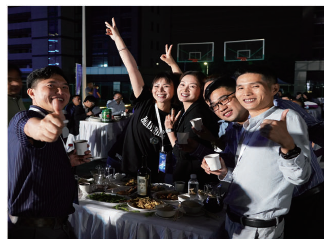
● 沙龙美食派对活动现场