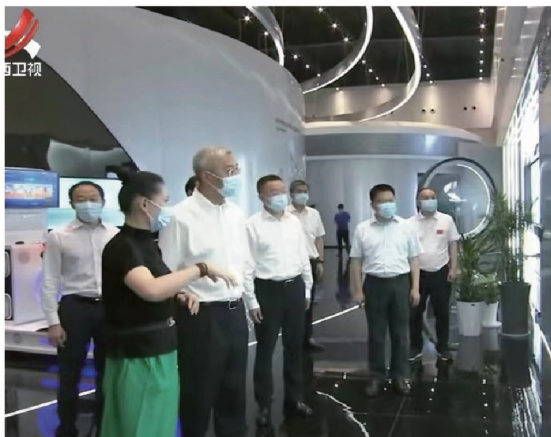
调研组实地查看企业相关情况

6月17日，江西省委书记尹弘一行莅临江西以晴数字经济产业园考察调研。江西省委常委、省委秘书长史文斌，以晴集团董事长周以晴、总裁洪哲森陪同调研。