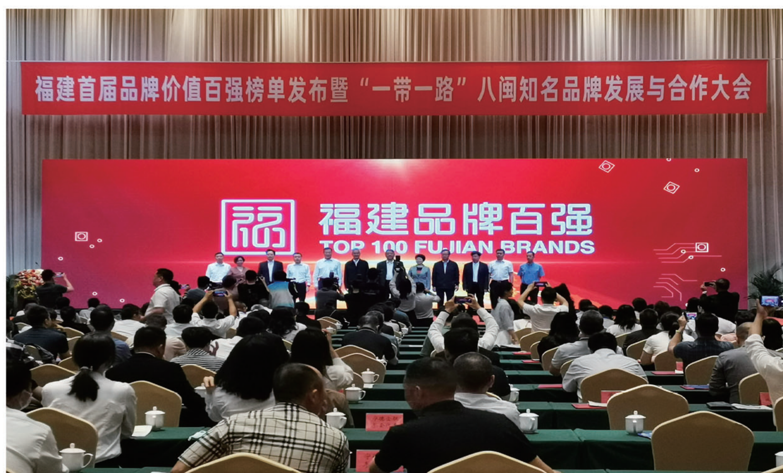
福建首届品牌价值百强榜单发布会现场

5月6日-7日,福建首届品牌价值百强榜单发布会在福建省宁德市举行。福建以晴科技集团有限公司以44.65亿元品牌价值入选“福建首届品牌价值百强榜单”,位列企业品牌第19名!