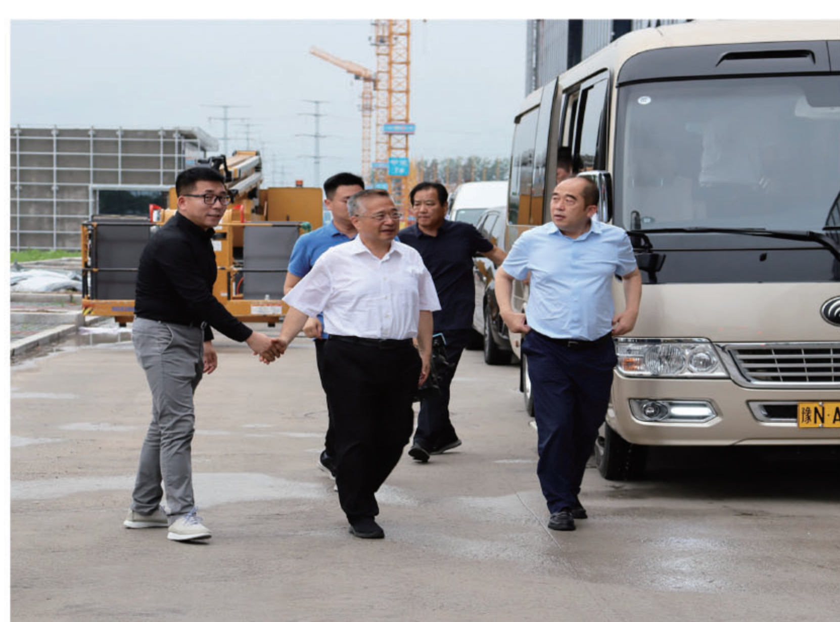
李国胜一行莅临商丘集美数智产业园调研

商丘市委常委、市委秘书长王金启，市委常委、常务副市长薛凤林，市人大常委会副主任、梁园区委书记张兵以及相关负责同志参加此次调研活动。