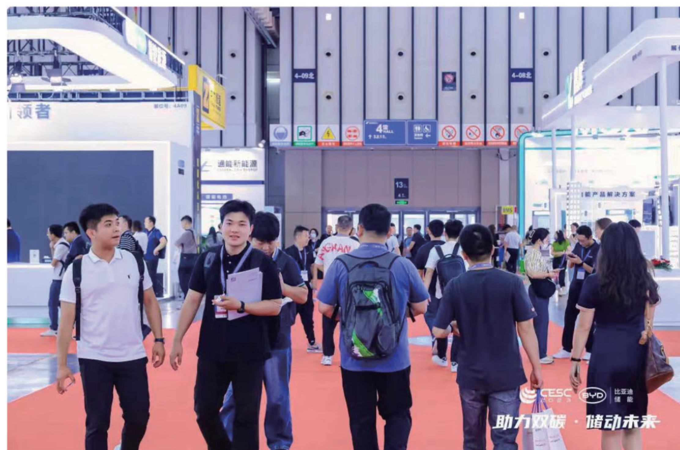
中国(江苏)国际储能大会现场

6月14日,由江苏省发改委、江苏省工信厅、江苏省商务厅、国网江苏省电力有限公司联合支持,江苏省储能行业协会主办的CESC 2023中国(江苏)国际储能大会暨智慧储能技术及应用展览会在南京国际博览中心开幕。以晴集团&菲力科便捷储能电源二代新品“豹”系列亮相展会。