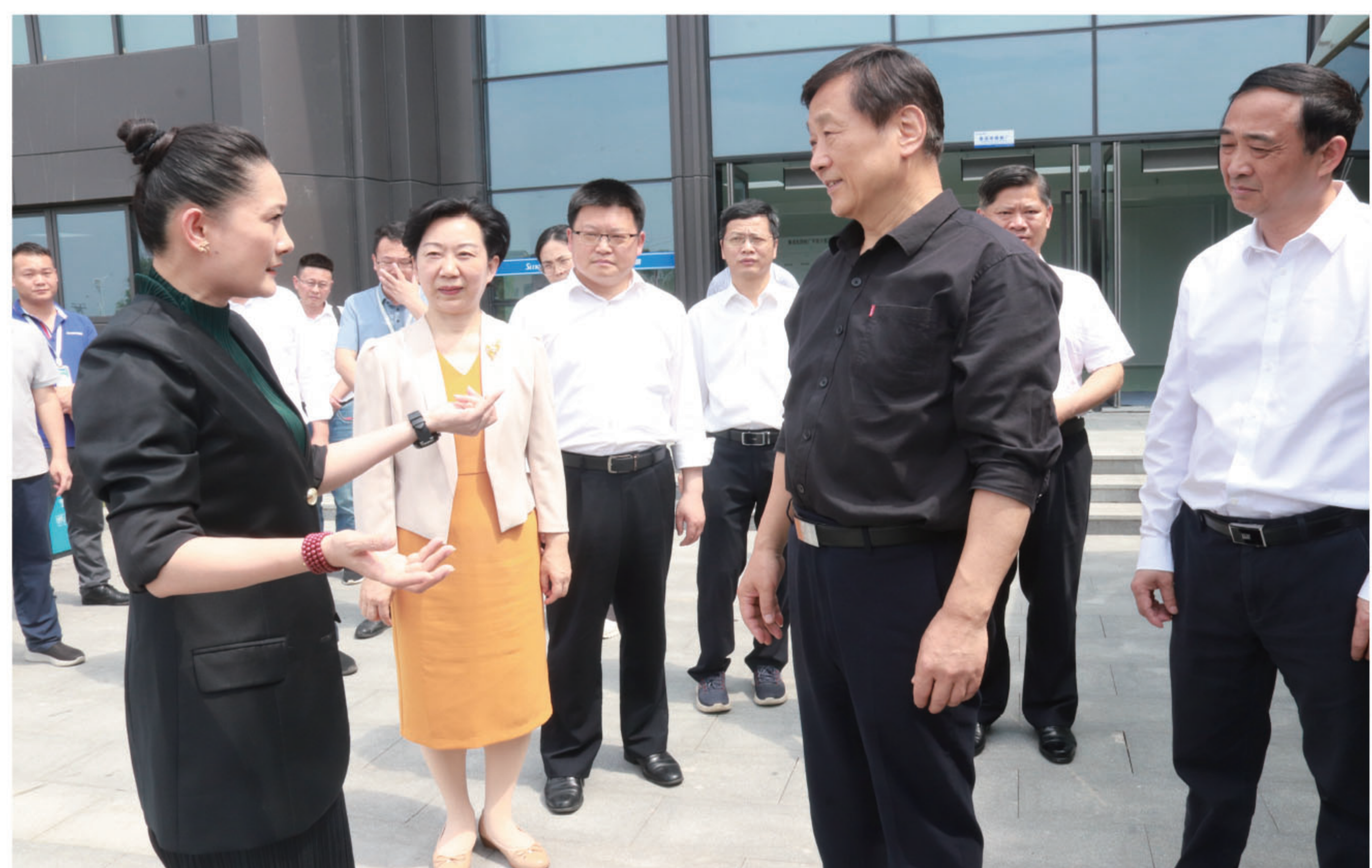
赵力平一行莅临江西以晴数字经济产业园考察调研

景德镇市人大常委会副主任、市委秘书长罗建国，浮梁县委书记程新宇，县委常委、副县长段铨松以及市、县相关负责同志参加此次调研活动。