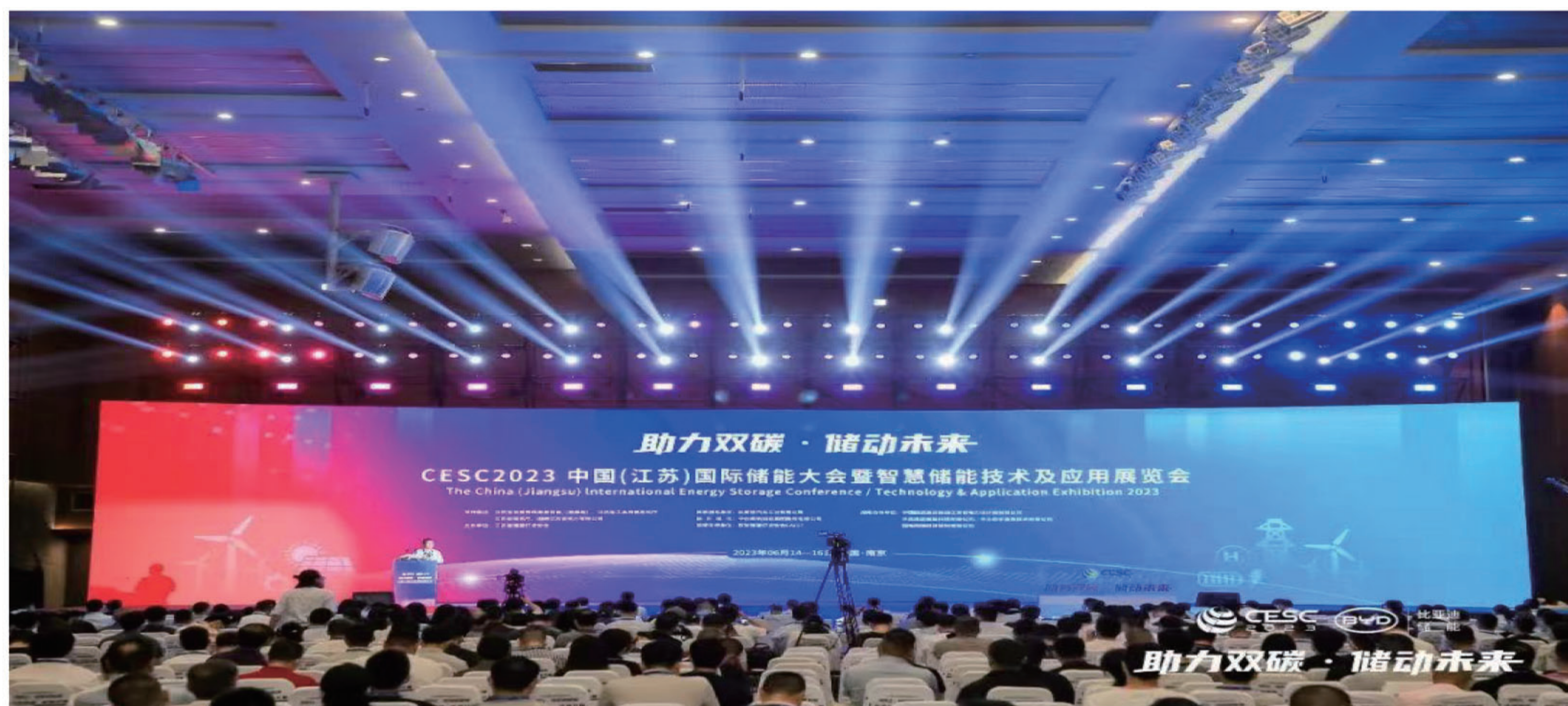
中国(江苏)国际储能大会现场