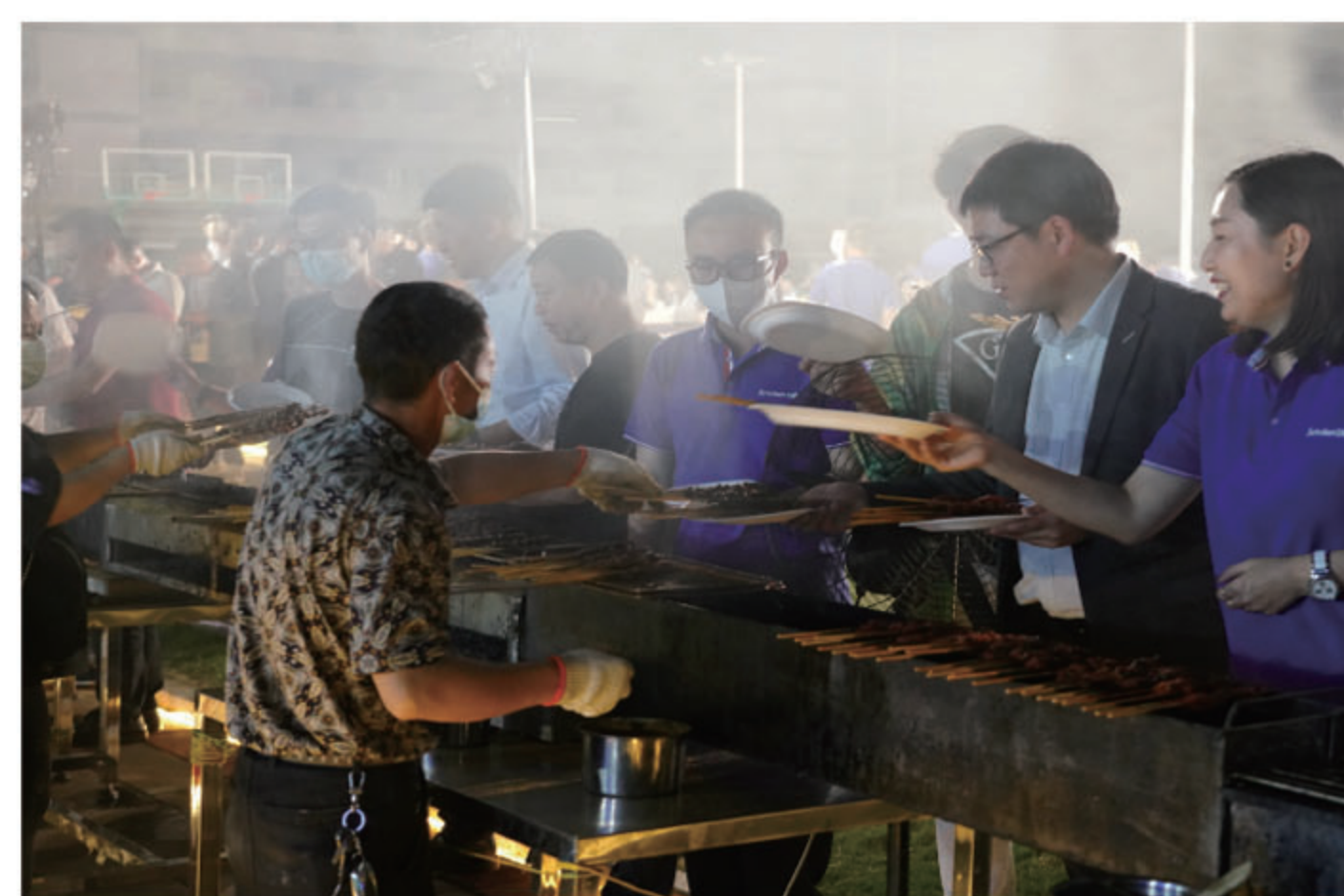
● 沙龙美食派对活动现场

回首过去,汗水孕育硕果,展望未来,我们更加信心满怀。未来,全体以晴人必将凝聚共识,铆足干劲,努力拼搏,奋力开创以晴集团更加美好的未来。