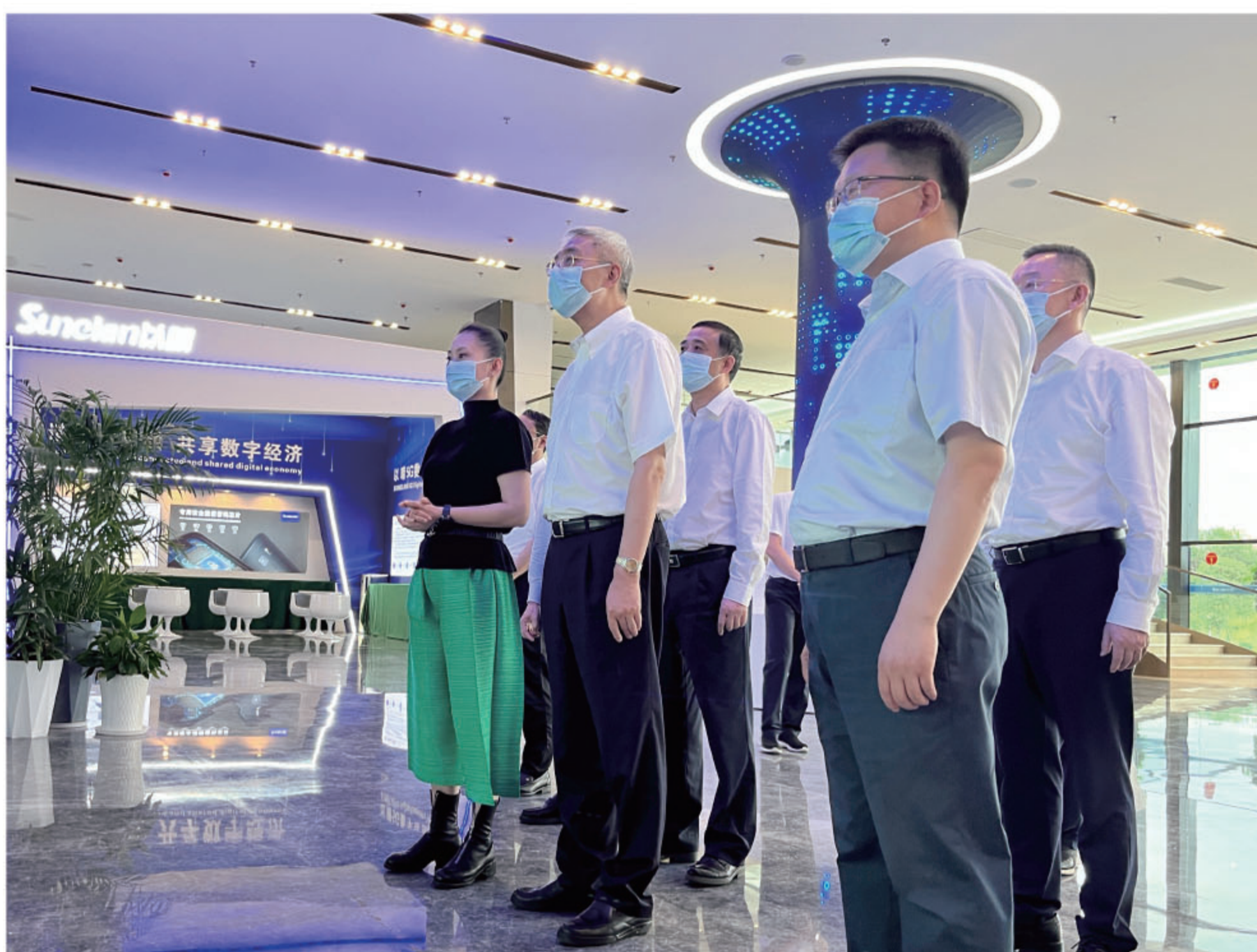
尹弘一行莅临江西以晴数字经济产业园考察调研